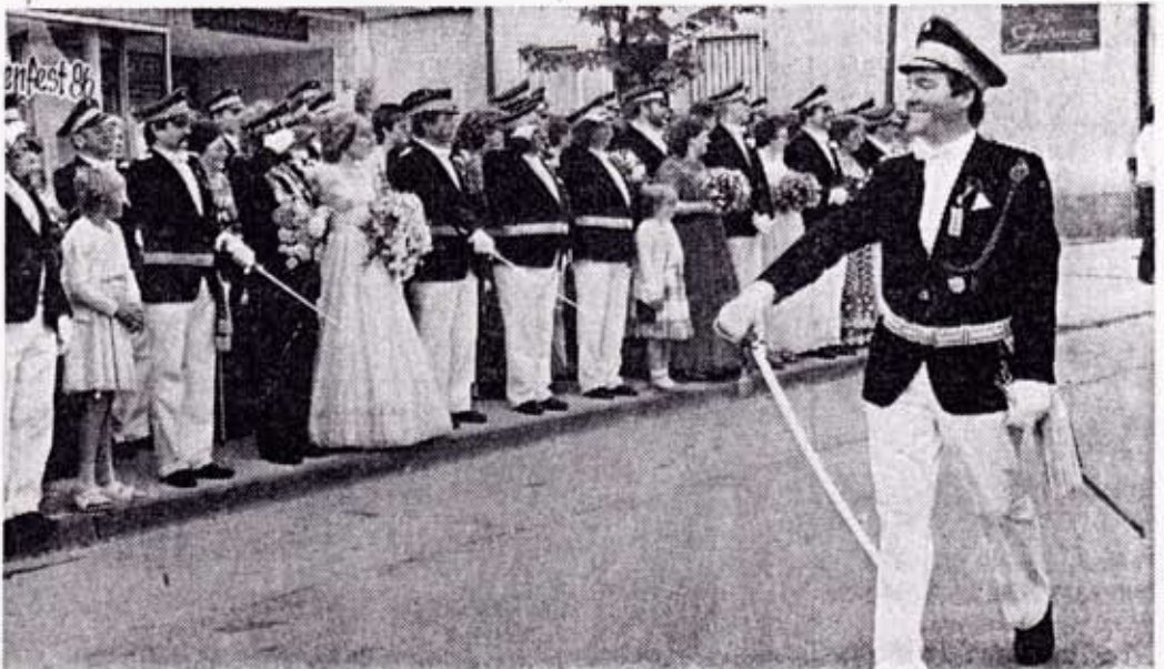
Zur Parade der Schützen säumten in Allagen jede Menge begeisterte Zuschauer die Straßen. (WMZ-Bild)